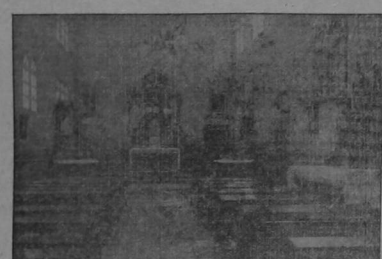
LA CAPILLA DEL ESTABLECIMIENTO