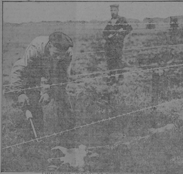
INNOCENT VICTIM OF THE WAR

WARTIME ELECTRIFIED BARBED WIRE COST PUSSY ALL OF HER NINE LIVES.